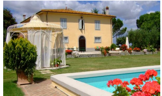
Hus 1: Casa Casti

Kurset gjør tydelig hvordan verktøyet Samspillsmetoden Dialog kan brukes for å arbeide med den nye Rammeplanen for barnehager og Bergen kommunes kvalitetsutviklingsplan for kommunale barnehager ; «Sammen for kvalitet - lek og læring».